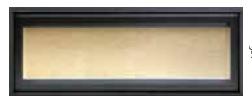
sem aro opcional