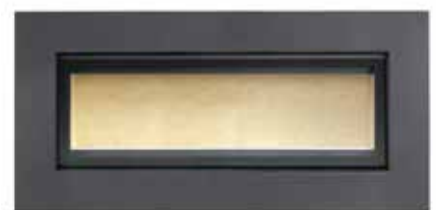
com aro opcional