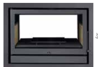
900 675 com aro integral de 5 cm inox ou à cor