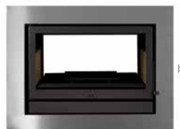
1000 775 com aro integral de 10 cm inox ou à cor