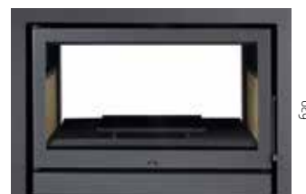
900 630 com aro de 3 lados de 5 cm