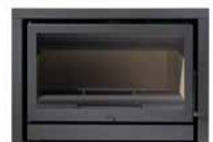
900 630 com aro de 3 lados 5 cm