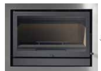
900 675 com aro integral de 5 cm à cor ou inox