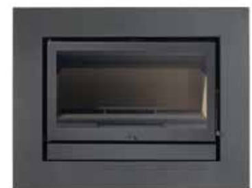
1000 775 com aro integral de 10 cm à cor ou inox